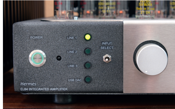
Mit dem Kippschalter auf der Front des Tsakiridis Hermes lassen sich die vier Eingänge schalten. Links daneben: der Power-Knopf

Ansonsten gibt es auf der Front noch den Netzschalter, den Lautstärkereglern und einen Kopfhöreranschluss (6,35 mm) sowie ein hübsches, kleines Rundinstrument, das den Ruhestrom der Leistungsröhren