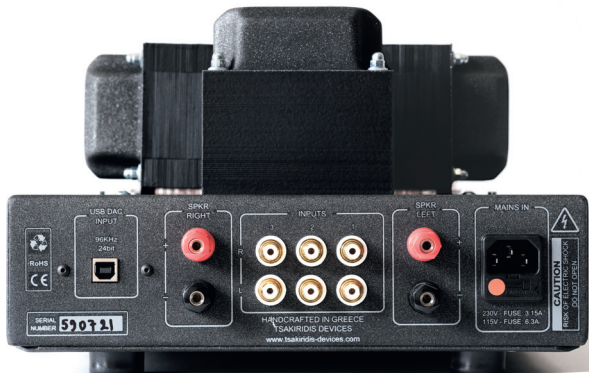
Rückseite des Tsakiridis Hermes: Drei Hochpegeleingänge, einmal USB-B und ein einfach ausgeführtes Lautsprecherterminal – das ist schon alles und sollte für die meisten Zwecke ja auch reichen

Wie gesagt, die EL84 hat ihre Fans. Die kompakte Leistungsröhre ist eine relativ junge Entwicklung aus der Zeit, kurz bevor Transistorgeräte den Markt übernahmen. Sie gilt als robust und leicht zu beschalten und wurde deshalb häufig in Radios verwendet. Ersatz ist erfreulich preiswert zu beschaffen, es gibt sogar noch nennenswerte NOS-Bestände (NOS = New Old Stock, unbenutzte Röhren aus alten Produktionsbeständen). Die amerikanische Bezeichnung ist 6BQ5. In den 1990er Jahren erlebte sie mit Verstärkern wie Manley Stingray (den Stingray II hatten wir im Test), Tube Technology Unisis oder EAR Yoshino V12 und weiteren einen kleinen Boom.