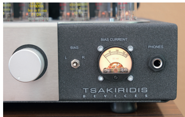
Sieht hübsch aus, hat aber nur informatorischen Charakter: Das Anzeigeeinstrument des Hermes auf der rechten Seite der Front

Trotz ihrer recht hohen Betriebstemperatur – auf eine ausreichende Belüftung des Verstärkers beziehungsweise der Röhren sollte man achten –, weist die EL84 eine lange Lebensdauer auf. Die der ab Werk mitgelieferten acht EL84 von JJ aus der Slowakischen Republik veranschlagt Tsakiridis auf 5000 Stunden. Wer jeden Tag vier Stunden Musik hört, sollte die Röhren also nach gut drei Jahren austauschen. Die Lebensdauer der als Eingangsröhre eingesetzten 12AX7 und der beiden als Treiberstufen dienenden 12AT7, jeweils von Electro Harmonix aus Russland, dürfte noch wesentlich länger ausfallen.