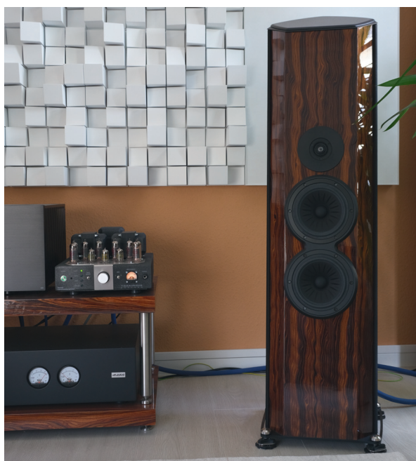
Tsakiridis Hermes im Hörraum mit dem Lautsprecher Divine Acoustics Bellatrix

Zum Schluss möchte ich noch wissen, was von dem eingebauten DAC des Tsakiridis Hermes zu halten ist. Wenn mein RME ADI-2 DAC FS die Daten zurück in Musik wandelt, geht da natürlich mehr. Der DAC im Hermes erreicht vor allem in Sachen Auflösung und Feindynamik nicht das Niveau des externen Studio-DACs. Ich möchte keinen Hehl daraus machen, dass