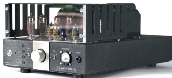
Setzt auf Transparenz: Der Tsakiridis kommt mit einer Abdeckhaube, die eine Plexiglasscheibe besitzt

Über den im Hermes eingebauten DAC schweigt sich Tsakiridis Devices aus. Die Squeezebox-Server-Software auf meinem Antipodes S40 zeigt, dass sich der Hermes mit einem Burr-Brown-Chip anmeldet. Ein Blick auf die entsprechende Platine im Inneren des Hermes lässt den Chip nicht erkennen. Auffällig ist, dass die Platine offenbar keinen Stromanschluss hat, sodass der Chip wohl über den USB-Anschluss mit Strom versorgt wird. Das spricht eher für einen einfachen Wandler. PCM-Daten verarbeitet er bis 24 Bit/96 kHz. Na, ich werde später mal ein Ohr riskieren.