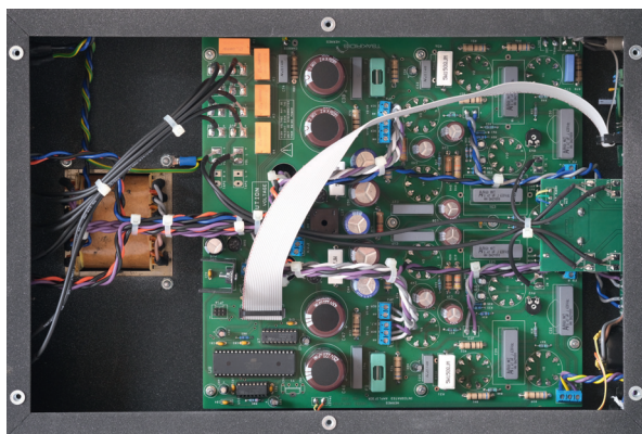
Blick von unten auf die Platine und den Trafo des Tsakiridis Hermes

Der Tsakiridis Hermes hat jeweils nur ein Paar Lautsprecherklemmen pro Kanal. Seine Übertrager sind für Lautsprecher mit einer Impedanz von sechs Ohm ausgelegt, eine Praxis, der mittlerweile viele Hersteller von Röhrenverstärkern folgen. Das ist einfach pragmatisch, denn die Impedanz von Lautsprechern schwankt über die Frequenz meist eh stark, sodass sich die Angabe, ob ein Lautsprecher vier oder acht Ohm hat, lediglich auf den Mittelwert bezieht. Dazu kommt, dass Übertrager, die Abgriffe für Vier- und für Acht-Ohm-Lautsprecher besitzen, aufwendiger zu wickeln sind und dass je nach gewähltem Anschlusswiderstand Teile der Übertragerwicklungen ungenutzt bleiben.